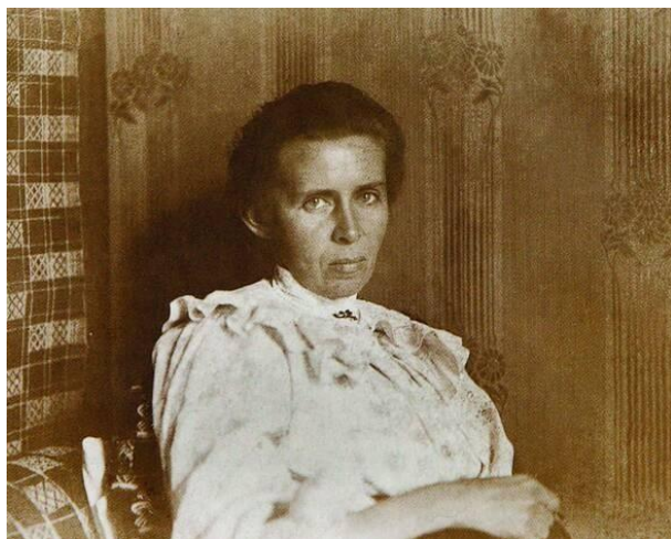
(Фото Лесі Українки у зрілому віці)

У 1971 році з нагоди 100-літнього ювілею письменниці у селі Ярославичах на Млинівщині відбулося урочисте встановлення меморіальної дошки з написом: «1881 року в селі Чекно (нині Межиріччя Ярославницької сільської ради) вивчала народні веснянки українська поетеса Леся Українка».