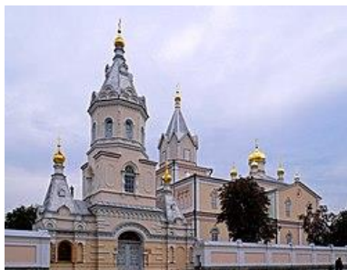
(Фото руїн Корецького замку та Корецького монастиря)

На Рівненщині, у колишньому Млинівському районі, є село Чекно. Хоч маленьке, та має багату історію. Колись тут діяв монетний двір – гроші чеканили князі Київської Русі, зокрема Ярослав Ізяславич, ще у XII столітті!